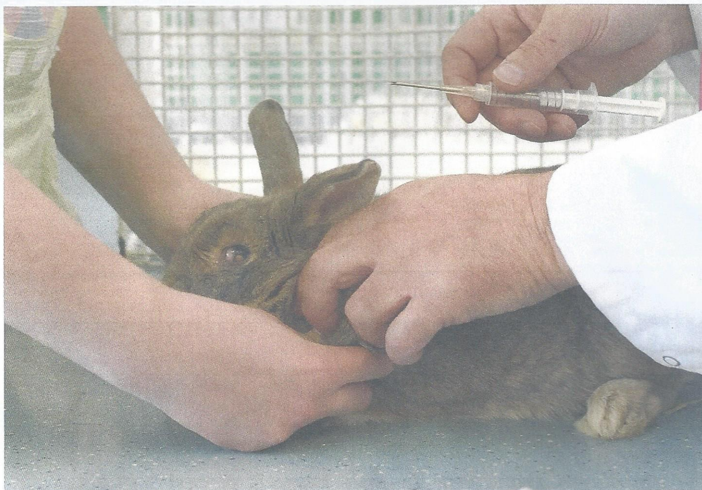
Ook de asielkonijnen krijgen een chip.

Dieren kunnen nog wel eens ongewild van hun eigenaar gescheiden worden. Ze lopen weg, raken verdwaald of ontsnappen. Als het dier gechipt is én de chip is goed geregistreerd, wordt de kans op een hereniging tussen dier en baas een stuk groter.