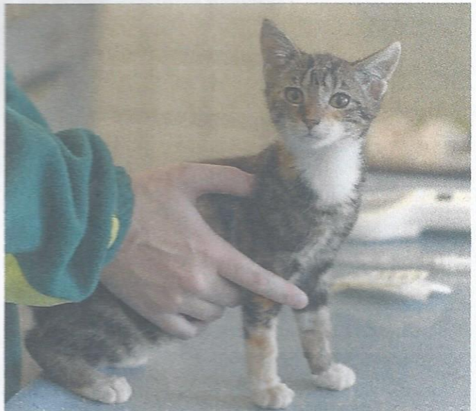
Dit kitten is klaar om gechipt te worden.